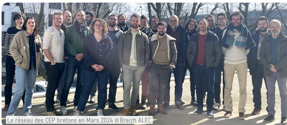
Le réseau des CEP bretons en Mars 2024

Vous avez reçu cette gazette par l'intermédiaire du Conseiller en Énergie Partagé (CEP) de votre territoire. Que votre collectivité bénéficie ou non de ce service, découvrez comment le réseau breton peut accompagner votre collectivité : énergie, financements de projets, etc.