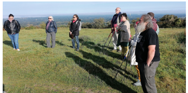
Balade sur le paysage et l'éolien

Le travail de concertation citoyenne a mis en lumière la nécessité d'améliorer la concertation, l'information et la communication autour des projets éoliens. L'étude a souligné la volonté des acteurs locaux d'être plus impliqués dans la gouvernance des projets et dans le partage des retombées économiques.